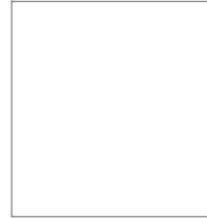
Right index fingerprint of alien removed

(Signature of alien being fingerprinted)